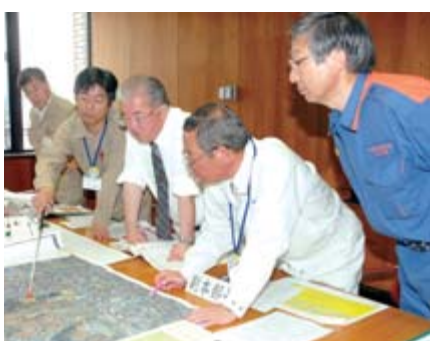
各機関との協力体制を確認した情報伝達訓練

訓練は宮城県沖を震源とするマグニチュード8の地震が発生し、市内で震度6弱および5強を記録したという想定で開始。市災害対策本部が岩手県建設業協会一関支部および同千厩支部に災害協定に基づく出動を要請し、各地域の被災状況の把握や