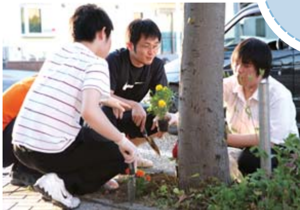
街路樹の根本に花苗を植えていく生徒たち