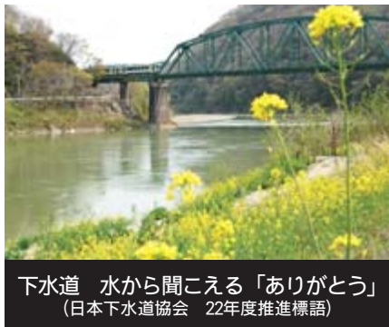
下水道 水から聞こえる「ありがとう」 (日本下水道協会 22年度推進標語)

市は自然と共生する住みよい環境づくりのため、公共下水道の整備を進めています。 22年度は、一関・花泉・千厩・東山地域のうち下表に示した8地区で、下水管きよの延長約8千メートルの工事を実施します。 下水道工事は道路での工事が多く、交通規制などご不便をおかけする期間がありますが、安全を最優先に行いますので、皆さんにはご理解とご協力をお願いします。 なお、工事に当たっては事前に関係する皆さんを対象に説明会を開催します。後日文書でご案内しますので、ご出席くださるようお願いいたします。