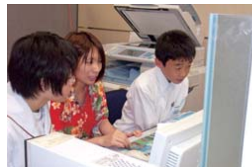
昨年の体験学習の様子