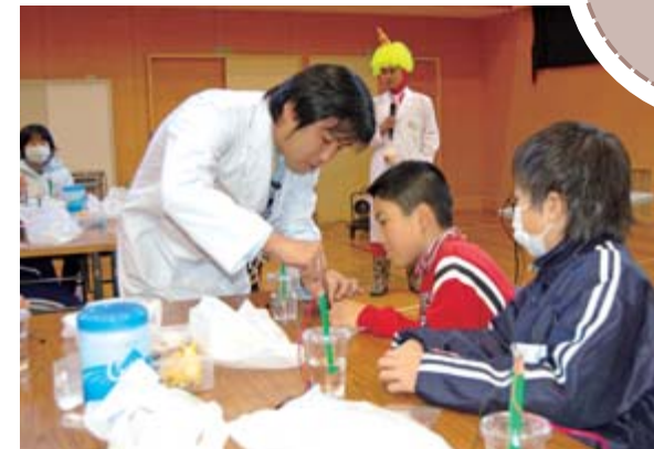
鉛筆電池を作り水の電気分解と発電を体験する児童たち