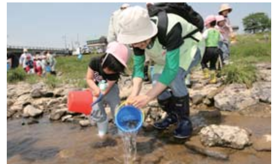
清流化を願って行われた磐井川のアユ放流

川や海の水質については、水質汚濁の代表的な指標であるBOD(※生物化学的酸素要求量)などの環境基準が定められ、国や県、市などで定期的に河川の水質検査を行っています。平成17年度から19年度までの市内の主な河川のBOD値は、左表のとおりでした。ここ2、3年間の水質状況は、おおむね横ばい状況にあり、今後とも推移を注視していくこととしています。