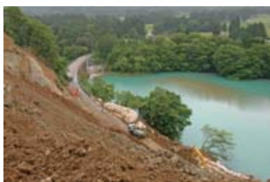
▲現在通行止めとなっている矢びつダム周辺の国道342号。日々大量の土砂が搬出されている(5月30日撮影)