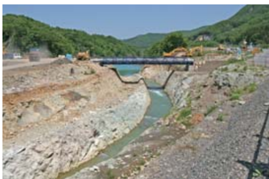
▶崩落した大量の土砂が磐井川をせき止めた市野々原地内の仮排水路。本復旧に向けて6月から仮排水路の拡幅工事が始まった。右側は国道342号(6月2日撮影)