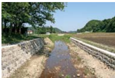
▼被災前の自然石を利用して復旧された夏梨川の護岸(6月2日撮影)