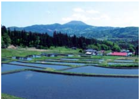
北限の棚田と称される「山吹棚田」(大東町大原地内)

本計画では、本寺地区を除く市全域を景観計画区域と定め、良好な景観形成の方針や行為の制限などをまとめました。