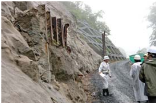
▲現在通行止めとなっている国道342号真湯一須川高原温泉間の茂庭沢の大規模なり面崩壊により道路が落下した現場。中央左寄りの鉄の構造物は以前の落石防止柵。斜面はモルタル吹き付けで仮復旧し工事中の崩落を抑えている(5月30日撮影)