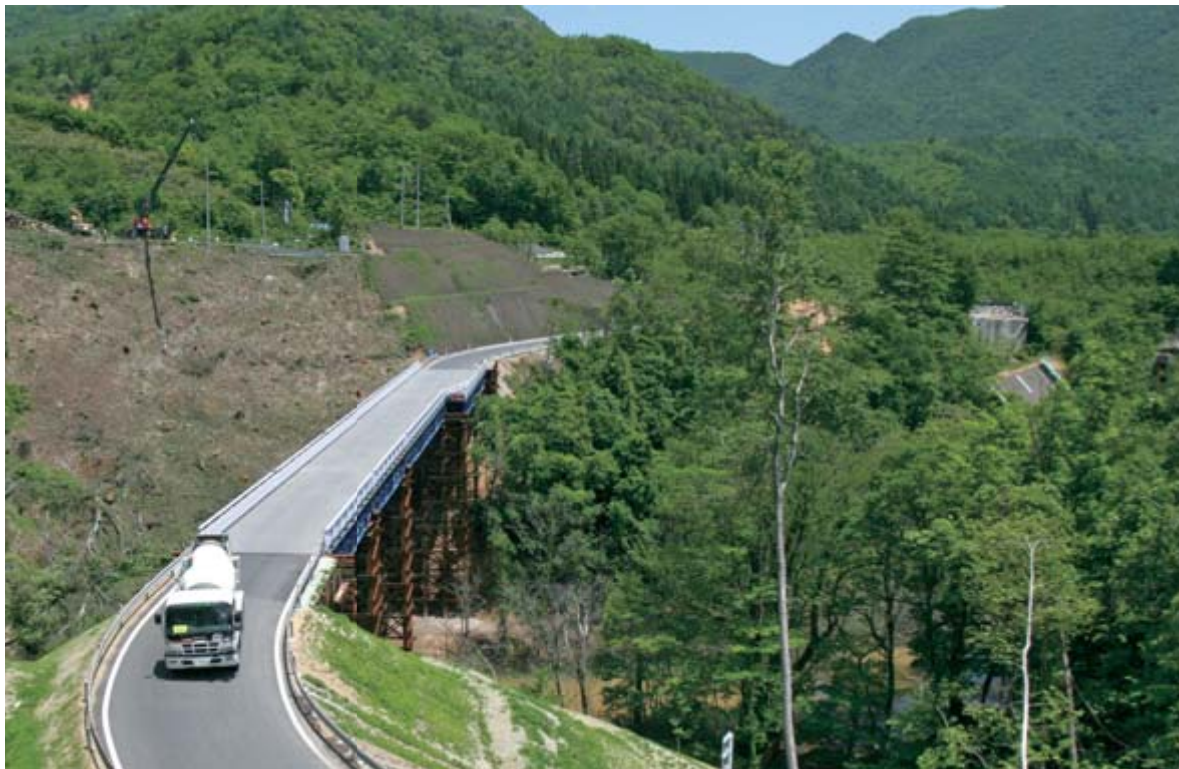
▲中央が昨年11月下旬に開通した国道342号祭時大橋仮橋。右側は落下した祭時大橋。左上部の工事現場は新設する橋の橋脚付近(6月2日撮影) ▼地震直後の祭時大橋(20年6月15日撮影)

本市西部を震源とする岩手・宮城内陸地震が発生して、1年が経過します。死亡1人、負傷2人の人的被害をはじめ、大規模な土砂崩れなど、甚大な被害がありました。関係機関などの尽力により復旧作業が進み、復興へ着々と進んでいます。本号では、被災後の現在までの状況を改めてお知らせします。 (後編は市民防災フォーラムの模様などを広報7月1日号に掲載予定)