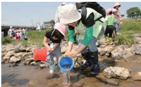
清流化を願って行われた磐井川のアユ放流

川や海の水質については、水質汚濁の代表的な指標であるBOD(※生物化学的酸素要求量)などの環境基準が定められ、国や県、市などで定期的に河川の水質検査を行っています。平成17年度から19年度までの市内の主な河川のBOD値は、左表のとおりでした。ここ2、3年間の水質状況は、おおむね横ばい状況にあり、今後とも推移を注視していくこととしています。