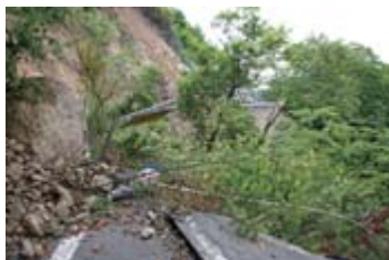
▼地震直後の茂庭沢付近(20年6月26日撮影)