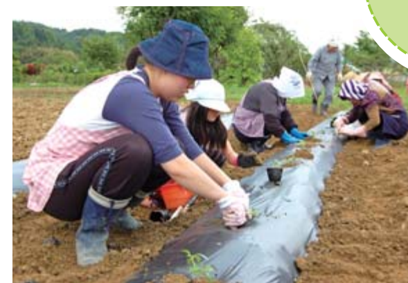
生活研究グループ会員から野菜作りを学んだ参加者