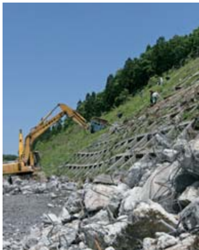
▲大規模なり面崩壊などのあった市道鬼頭明通(おにかべあけどおし)線(6月2日撮影)