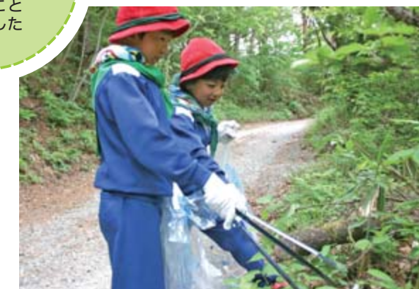
束稲森林愛護少年団員が登山道を歩きごみを拾いました

農家以外の人にも農業に興味を持ってもらうため、野菜作りや加工実習など定期的に開設するこの講座。初回のこの日は、モロヘイヤなど夏野菜の定植作業を行いました。真柴から子どもたちと参加した女性は「野菜作りを本格的に学びたい」と会員の手つきを見ながら丁寧に苗を植えていました。