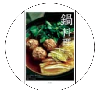
「鍋料理」 柴田書店 編

寒さが深まっていくこれからの時期、食卓に欠かせないのが鍋料理。「魚」「肉」「寄せ鍋」「野菜」「エスニック鍋」「小鍋」と章を設け、全101品を紹介。具材を器に盛った状態、調理のタイミングや食べごろがわかるプロセス写真もあり、よりわかりやすく解説しています。