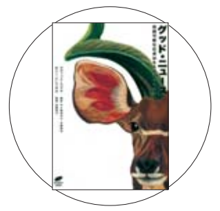
「GALLOP(ギャロップ)！」 ルーファス・パトラー・セダー 著

寒さが深まっていくこれからの時期、食卓に欠かせないのが鍋料理。「魚」「肉」「寄せ鍋」「野菜」「エスニック鍋」「小鍋」と章を設け、全101品を紹介。具材を器に盛った状態、調理のタイミングや食べごろがわかるプロセス写真もあり、よりわかりやすく解説しています。