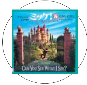
「チャレンジミッパ! 5 むかしむかし」 ウォルター ウィック 著

著者の奥玉道子さんは、室根町折壁の出身です。53歳から描きはじめ、現在は水墨画教室を主宰するご自身が、絹に描く描法を解説した本邦初の指導書となっています。絹の描法を写真と図版で丁寧に指導し、水墨画を絹に描く楽しさとその魅力を紹介しています。