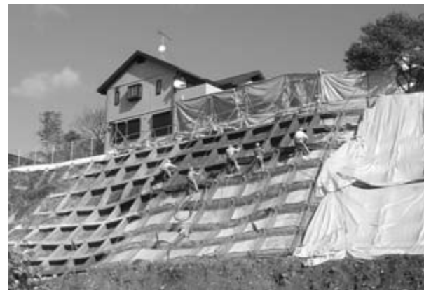
赤荻字鬼吉地内の急傾斜地崩壊対策工事