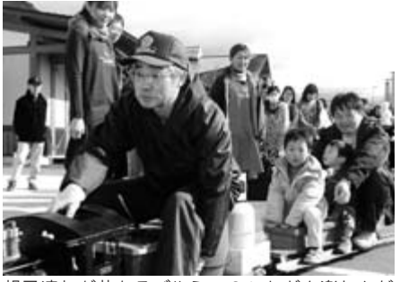
親子連れが昔あそびやミニSSLなどを楽しんだ「きらり☆わいわいっこまつり」(19年度助成事業)