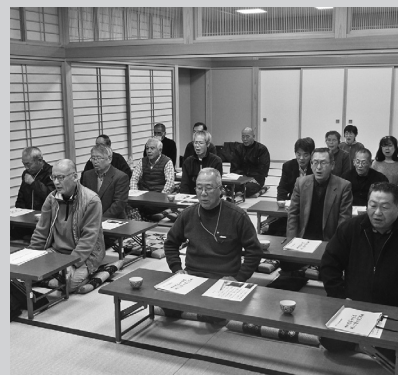
声に出して練習する受講生