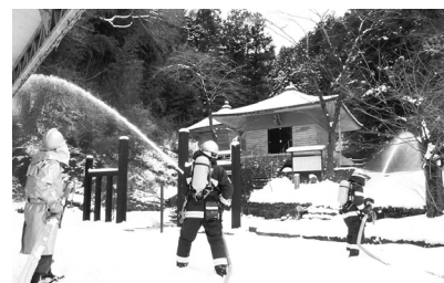
延焼拡大を阻止する放水訓練

市と市教委、市消防本部が主催する一関市文化財防火訓練は1月28日、「二十五菩薩像収蔵庫」周辺で行われ、参加住民らは文化財を災害から守る意識を高めました。