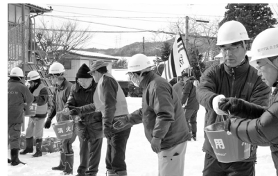
初期消火のバケツリレー訓練