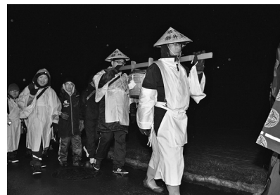
若水の入った桶を運びます