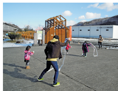
凧揚げに挑戦する参加者

地球っ子広場・ピースらんど「手作り凧をあげよう」は1月14日、石と賢治のミュージアムで行われ、3組7人の親子らが凧作りに挑戦しました。和紙にそれぞれ好きなイラストや動物、キャラクターなどを描き、組立てた竹の骨組みに貼り付けてオリジナルの凧を仕上げました。 同日は青空が広がり、程よく風もある凧揚げ日和。参加者らは走ったり、糸を操りながら高度を上げたりして思い思いに楽しんでいました。