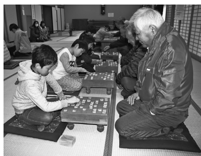
一手一手、相手の手を読みながら対局

猿沢市民センター主催の世代間交流事業「将棋教室」は1月9～11日の3日間、猿沢市民センターで開かれました。