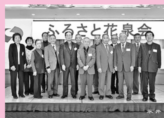
永井地区出身会員の皆さん