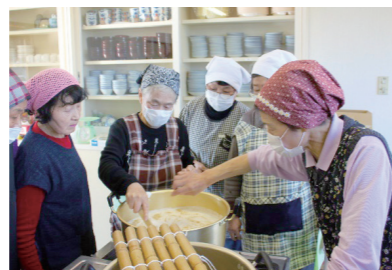
地元で収穫した農産物の加工を学ぶ「豆づくり教室」