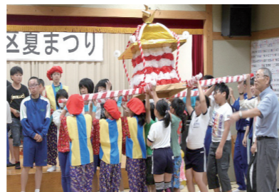
子供たちも大勢参加する「老松地区夏祭り子ども神輿」

老松市民センターは、昭和30年の町村合併で旧老松村役場に老松公民館として併設されました。その後、旧老松中学校校舎に移転。63年、現在の場所に移転新築されました。平成27年4月1日からは、地域づくりの拠点としての機能を加え、生涯学習の学びの場と地域づくり機能を一体化した「老松市民センター」となり、現在に至ります。