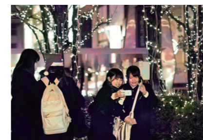
気軽に撮影して世界中と写真を共有できるのもネット社会ならではの

昨年から一関商工会議所青年部が加わり、新たに撮影スポットを設置。若者たちを中心とした、ソーシャルネットワークサービス(SNS)を使った情報の拡散を期待している。