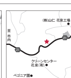
冬のスターマイン 花泉町日形字上通 2018年2月28日まで