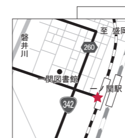
一ノ関駅周辺イルミネーション 一ノ関駅西口・駅前広場 2018年3月31日まで