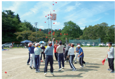
秋晴れの下、全力で地区民運動会に取り組む選手たち

磐清水市民センターは、昭和58年7月に農村集落多目的共同利用施設「磐清水文化センター」として、新築されました。また、磐清水水体育館は、昭和54年3月に新築され、地区住民の活動の場、学習の場として多くの住民に利用され、親しまれてきました。